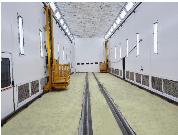
Foto1 - Interior de la cabina de pintura instalada en Min Sen Machinery - Bangkok.

La instalación proyectada e instalada por GEINSA dispone de armario de control con pantalla táctil y servicio de teleasistencia integrado.