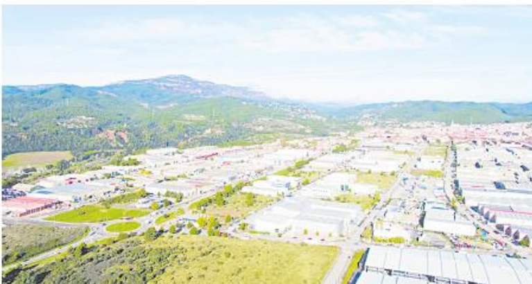
Castellar del Vallès.

Fem Vallès presenta un projecte per a Castellar per reduir el dèficit de llocs de treball